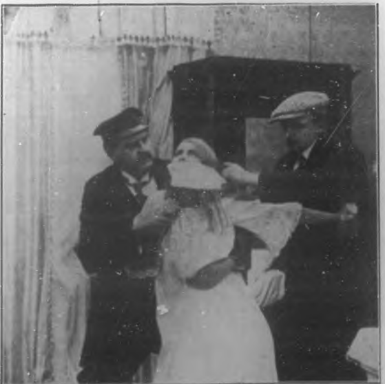
Quise gritar y la frialdad de una mordaza ahogó en mi garganta la voz.

—Oid,—prosiguió Raquel,—la historia de mi vida, y después, los que habéis aplaudido, decidme, si es o no cierto que en el fondo, en lo más íntimo del corazón de cada mujer, vive un recuerdo que es como una ofrenda al primer amante... Que es como un culto al primer beso... Escuchadme.