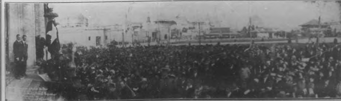
EN LA EXPOSICION DE SAN FRANCISCO.—Público ante el pabellón de Cuba escuchando el magistral discurso pronunciado el día de la apertura, por el General Enrique Loynaz del Castillo.

Envía calorosa felicitación a cuantos han contribuido al éxito.