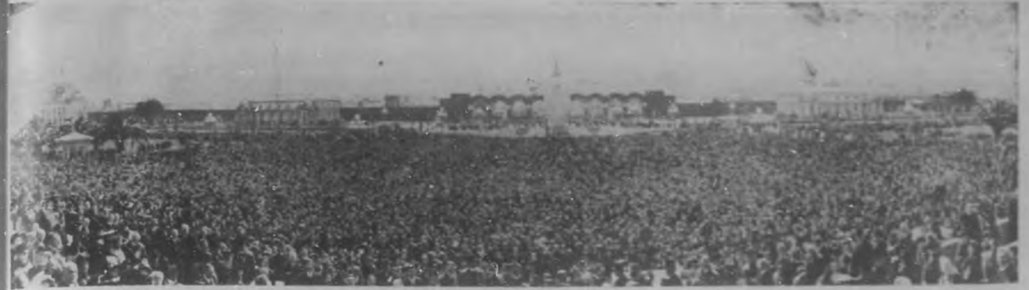
EN LA EXPOSICION DE SAN FRANCISCO.—Muchedumbre que presenció el acto de la inauguración de la Exposición.

La Secretaría de Agricultura, que tiene al frente a una de las capacidades más salientes de nuestros grandes hombres, el General Emilio Núñez, ha dado un gran relieve a la presentación de nuestras energías y de nuestra riqueza, con las obras que ha realizado, con la ayuda