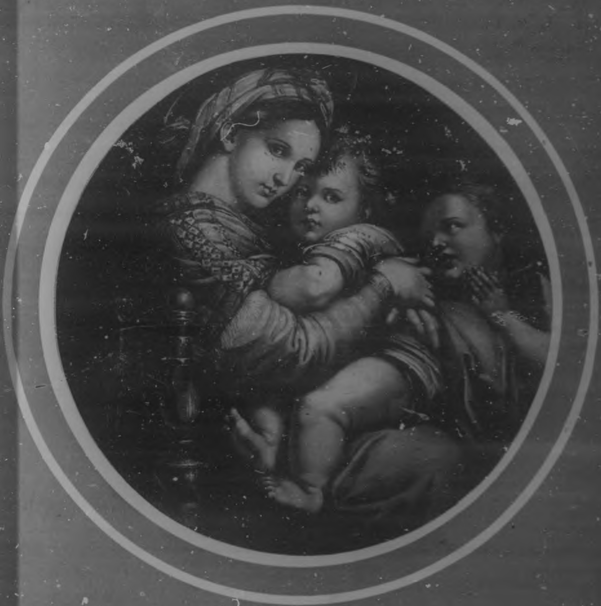
LA VIRGEN DE LA SILLA Cuadro por Rafael