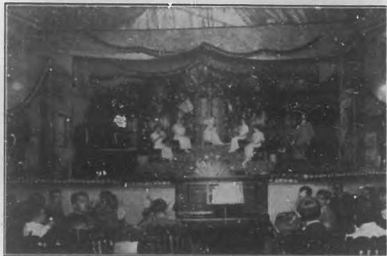
EL REINADO DE LAS FLORES DE CIEGO DE AVILA.—Vista del teatro "Oriondo" engalanado y público que concurrió a la gran velada de honor de la Reina de las Flores y sus Damas de Honor la noche del 12 del corriente.

"Banda Infantil". — Publicamos la fotografía de la banda infantil del progresivo y pintoresco Cárdenas, que fue inaugurada el día 20 de Mayo, de 1914, en la que figuran como directiva y organizadores elementos valiosos de dicha sociedad,