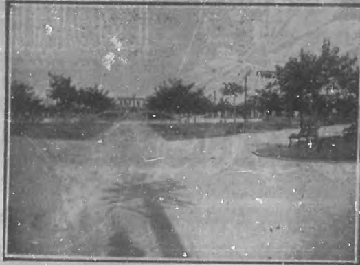
Los progresos urbanos. "Parque Menocal", Vedado.

LAS CASAS, en Luyanó; LA SERAFINA, BUEN RETIRO, LOMA LLAVES, ORIENTAL y COUNTRY CLUB PARK, en Marianao y en el Cerro (Calzada de Ayesterrán) en la Vibora y el Vedado.