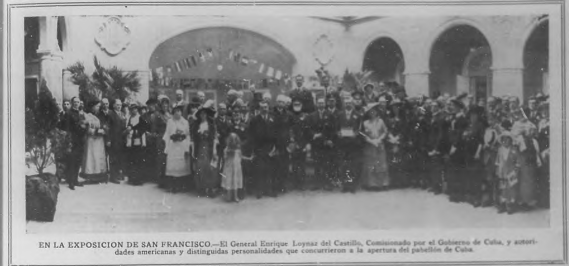
EN LA EXPOSICION DE SAN FRANCISCO.—El General Enrique Loynaz del Castillo, Comisionado por el Gobierno de Cuba, y autoridades americanas y distinguidas personalidades que concurrieron a la apertura del pabellón de Cuba.

que han lucido gallardamente sus riquezas, sus energías y su progreso.