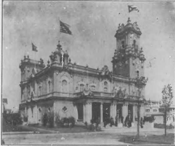
LA EXPOSICION DE SAN FRANCISCO.—Vista exterior del Pabellón de Cuba.

De cualquier manera, había que acudir a ese llamamiento, más con el temblor de la pequeñez, con el encogimiento del que posec fuerzas exiguas. No esperando para su consuelo sino débiles reflejos de la luz portentosa que cayera del cenit sobre la fama y los galardones de esas naciones colosales.