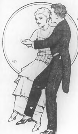
Lámina número 10