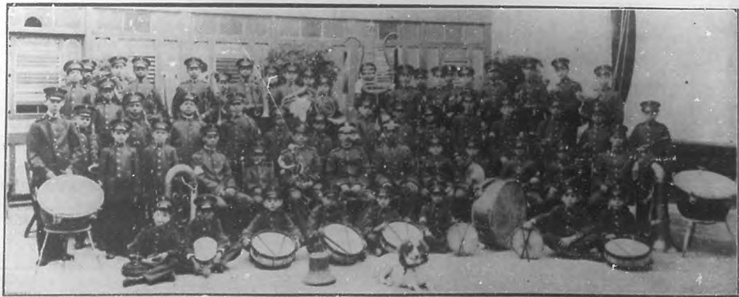
DE CARDENAS.—Banda Infantil, que ejecuta notables conciertos, y en la que figuran elementos artísticos de gran valer.