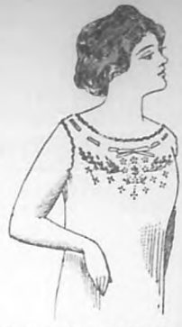
Bonito Camisón oñán hilo puro bordado y festoneado en todas las tallas y variados en más de 50 dibujos a $1.75.

ESPECIALIDAD EN EQUIPOS PARA NOVIA Neptuno 22. Teléfono A-7166. Habana.