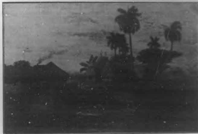
Oleo por J. Gil García.