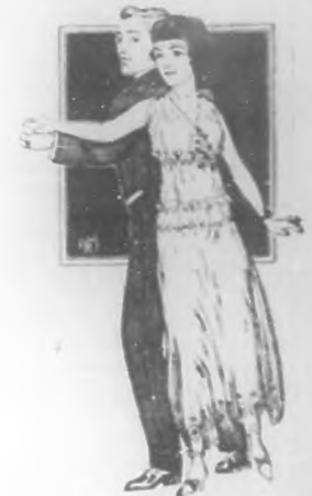
Lámina número 11

Hesitation, vals; hesitation, vals; 4 veces, en la quinta la señorita pasa por debajo del brazo izquierdo de su compañera; el que permanece estrado ha un delante sosteniendo la mano derecha de la señorita (V. Lám. 3). En esta posición ambos se balancean hacia delante del pie en el pie izquierdo y su compañera en el derecho. Balanceo hacia atrás, balanceo hacia el frente y en el otro balanceo hacia atrás, ambos pasos hacia el primer paso.